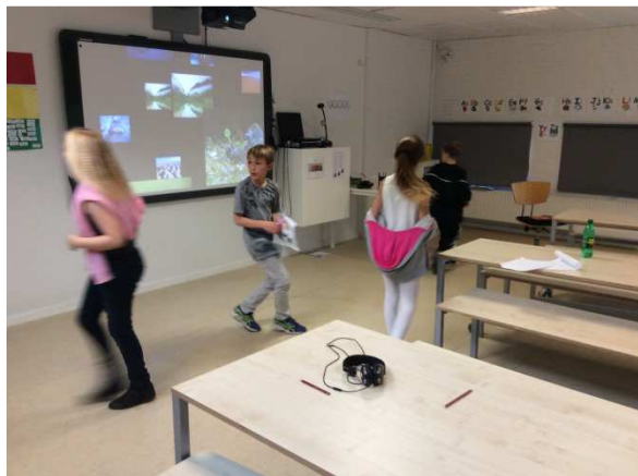
Børnene leder efter poster i skattejagten

I Birkerød Skoles SFK, 'Klubben' holder vi klubaftener for 4. og 5. klassestrin ca. hver anden uge fra september til april/maj. Det varer fra kl. 17-20, ved discoaftener er det til 20.30. I år har vi indtil videre afholdt 2 klubaftener. Ofte har vi et tema på, fx skattejagt, stjerneløb, filmaften, halloween eller disco – men vi holder også mange klubaftener med 'fri leg', hvor børnene kan lege mørkegemme eller spille bold.