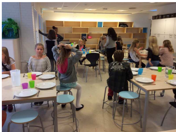
Børnene begynder at gå til bords

Vi spiser sammen. Børnene betaler 25 kr. til maden, som de afleverer dagen før, så vi kan købe ind for dem. Som regel får vi noget pasta, karry eller den slags, som vi ved, at de fleste af børnene godt kan lide. Når vi holder disco, kommer der rigtig mange børn. Til de almindelige klubaftener kommer der som regel mellem 20 og 30 børn.